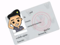
บัตรข้าราชการ

สมาชิกที่อยู่หน่วยนอกตามต่างจังหวัด ทางสภกรณ์ ฯ จะโอนเงินเข้าบัญชีให้กับสมาชิกที่มีรายชื่อทุกระดับชั้น (ยกเว้น ป.ตรี) ตาม QR CODE ดังนี้