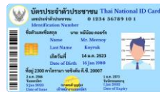
บัตรประชาชน